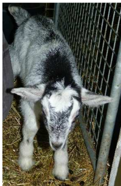
Les 1ères naissances VERTE (BE)