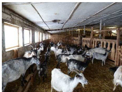
Ferme des Sureaux (BE)