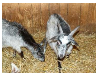
Ferme des Sonvaux (57)

bonne période pour assister aux 1ères naissances !